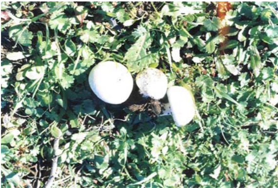
Figure 5. Agaricus semotus : fructifications à différentes âges.