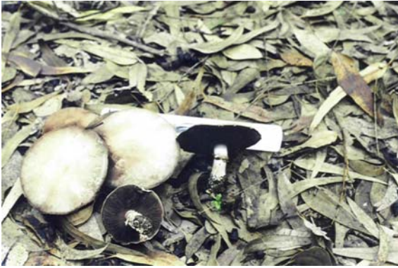
Figure 1. Agaricus menieri : fructifications à différents âges.