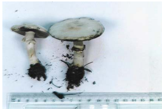
Figure 7. Agaricus comtulus : carpophore blanc et un pied à anneau fugace.