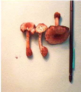
Figure 3. Agaricus porphyrizon : carpophores à différents âges.