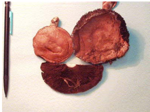
Figure 4. Agaricus vaporarius : carpophore à chapeau mamelonné.